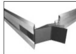
Zatraskowe blokady narożnikowe